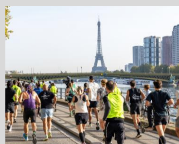
20 km Paris